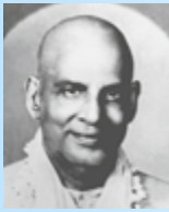
Swami Sivananda (1887–1963)